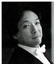
指揮 沼尻 竜典 (神奈川フィル音楽監督) Ryusuke NUMAJIRI, Conductor

2022年4月より神奈川フィルの音楽監督。これまで国内外数々のポストを歴任。ドイツではリュベック歌劇場音楽総監督を務め、オペラ公演、リュベック・フィルとのコンサートの双方において多くの名演を残した。ベルリン、ロンドン、パリ、モントリオール、シドニー等世界各国のオーケストラ、ケルン、ミュンヘン、ベルリン、バーゼル、シドニー等の歌劇場へも客演を重ねている。16年間にわたって芸術監督を務めたびわ湖ホールでは、ミヒャエル・ハンペの新演出による《ニーベルングの指環》を含め、ワーグナー作曲の主要10作品をすべて指揮した。14年にはオペラ《竹取物語》を作曲・初演、国内外で再演されている。17年紫綬褒章受章。